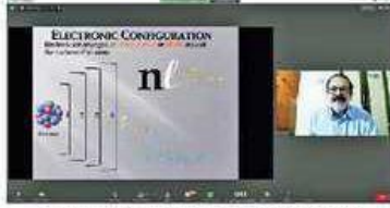
ఆన్లైన్లో శిక్షణ ఇస్తున్న అధ్యాపకుడు